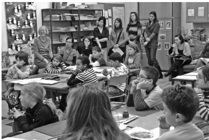
Tanulmányút és tapasztalatszerzés a bécsi EPS Dr. Leopold Zechner Iskolában