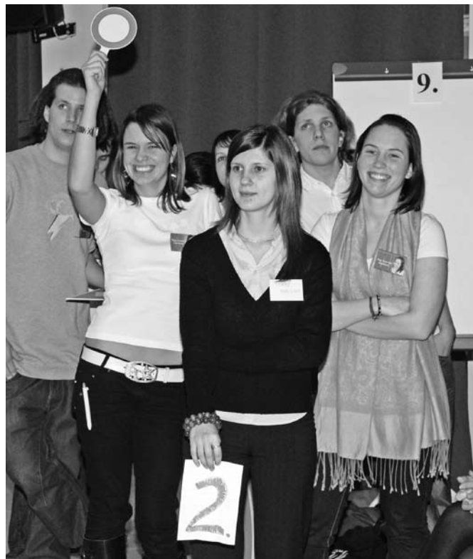
A jó hangulatú vetélkedő kilenc, többségében soproni középiskola vett részt