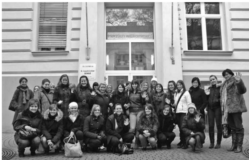
A többnyelvű Európában egymástól tanulhatunk

A tanulmányúton részt vevő hallgatók egyöntetű véleménye az volt, hogy szívesen dolgoznának a dip-