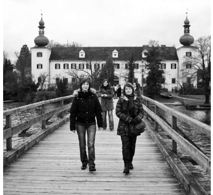
„Sajnos minden jó véget ér egyszer” - az utazás résztvevői azonban még sokáig emlékezni fognak a két napos kirándulásra.

Az este közeledtével elindultunk az 1000 méteres magasságot is elérő kanyargós szurdokvölgyön keresztül Golling városába, ahol egészséges fáradságot magunkban érezve elfoglaltuk kitűnő szállás-