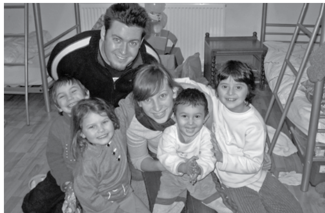
A gyerekek nagyon örültek, amikor megláttak minket és a rengeteg ajándékot

December 7-én kora reggel két mikrobuszal indultunk útnak. Először Nagyszalontán álltunk meg, ahova gyümölcsöt és játékokat vittünk. Örömmel tapasztaltuk, hogy épp előttünk jártak ott adományozók. Gyűjtésünk fő célpontja azonban nem is ez volt, hanem Gálospetri. Körülbelül délután 2-3 között érkeztünk meg. A gyerekek nagyon örültek, amikor megláttak minket és a rengeteg ajándékot. A sok doboz kikapcsolásában örömmel segítettek még a legkisebbek is. A kisbuszok kiürítése után a gyerekek az épület étkezőjében énekeltek nekünk karácsonyi dalokat, majd megkapták a mikulás csomagokat. Egy kis játék és beszélgetés után a hosszú útra való tekintettel elbúcsúztunk tőlük és nevelőjüktől, majd hazaindultunk. Úgy gondolom, hogy mind a szervezők, mind az adományozók és a támogatóink is jócselekedetet vittek véghez. Remélem, hogy a jövőben is lesz lehetőségünk ilyen jellegű tevékenységet végezni.