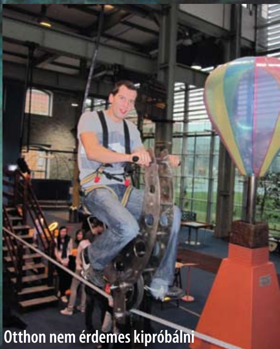
Otthon nem érdemes kipróbálni

Régóta dédelgetett terv valósult meg 2010. február 26-án, amikor a Geoinformatika Kar hatvan hallgatója a budapesti Csodák palotájába kirándult. A látogatás teljes költségét a Geinformatika Kar Hallgatói Önkormányzata finanszírozta. (Cikkünk a 7. oldalon olvasható.)