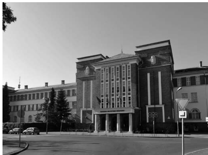
A Savaria Egyetemi Központ főépülete

megszerette. Amerikai létére csodálatosan ráérez a magyar társadalmi problémákra, munkáinak nagy részéből sugárzik a magyarságszeretet, a népi kultúra átélése és az egyszerű, földből élő emberek iránt érzett tisztelet. Megtanult magyarul, évekig tanult magyar mesterektől. Amerikában kulturális misszióknak tekintette a magyar kultúra népszerűsítését. Különleges „szurnaiv” stílusban festett olajfestményeiben mindig van egy, a látvány mögötti üzenet, mely a dolgok mélyebb értelmét sejteti.