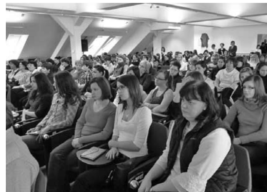
A névadó ünnepségen is megtelt a Brunszvik-terem