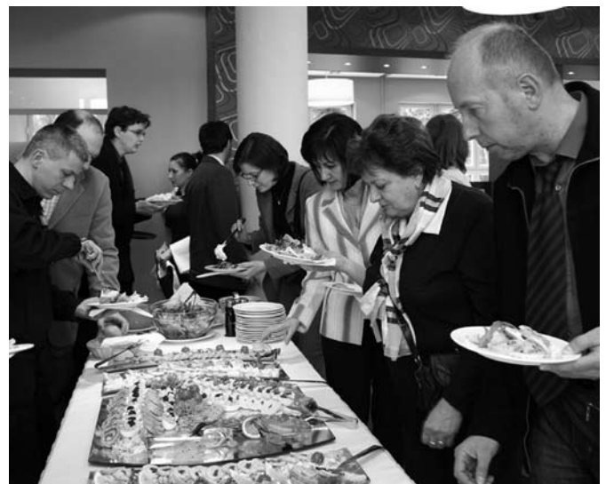
Közelharc az utolsó kaszinótojásért a Nyugat Étterem megnyitóján