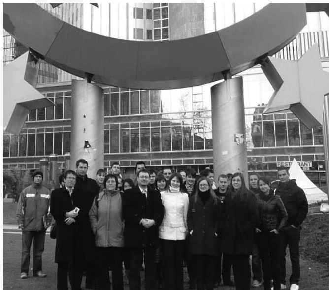
A pénzügyes csapat az Európai Központi Bank jelképe előtt, Frankfurtban

2010. március közepén a Közgazdaságtudományi Kar pénzügyes, illetve a téma iránt érdeklődő hallgatóival, az európai pénzügyi világ egyik legfontosabb üzleti- és bankközpontjában, Frankfurtban jártunk.