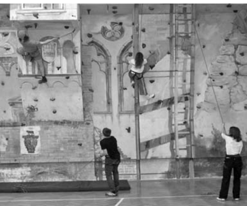
Mászófal a Bolyaiban

Ennek színterei a tanórák, a sportköri foglalkozások, a délutáni tehetésgondozás, valamint a testnevelés munkaközösség által szervezett táborok (turisztikai, kerékpáros, kajak-kenus és a tanévenkénti három sítábor). Ezen alkalmak nagyon jó lehetőséget kínálnak a tanulók fejlesztésére, oktatására, nevelésére, a sportban rejlő nevelési lehetőségek sokaságának felhasználásával.