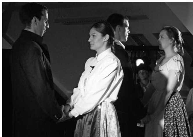
A darab szereplői közé valamennyi soproni karról érkeztek hallgatók

Érzelmes képeken, hangulatos jeleneteken keresztül mutatta be az 1848-as forradalmi események jelentőségét a Benedek Elek Pedagógiai Kar ünnepi műsora, március 16-án délben, a tetőtéri előadóteremben. Az „Indulj el egy úton...” című darab írója és rendezője Kalányos Tamás szociálpedagógus hallgató volt, míg a szereplők sorába a benedekes hallgatókon kívül az egyetem Erdőmérnöki -, Faipari Mérnöki -, valamint Közgazdaságtudományi Karáról is érkeztek hallgatók. Újdonság, hogy idén már szakközépiskolásokkal is bővült a szereplői gárda. A Vas- és Villamosipari Szakközépiskolából, az Eötvös József Evangélikus Gimnázium és Egészségügyi Szakközépiskolából, és a Berzsényi Dániel Evangélikus Líceumból is érkeztek fellépők, illetve technikai segítők. A táncos jeleneteket a Testvériség Táncegyüttes és az Ürmös Néptáncegyüttes tagjainak köszönhetette a tetőtéri termet zsúfolásig megtöltő, nagy számú nézőközönség.