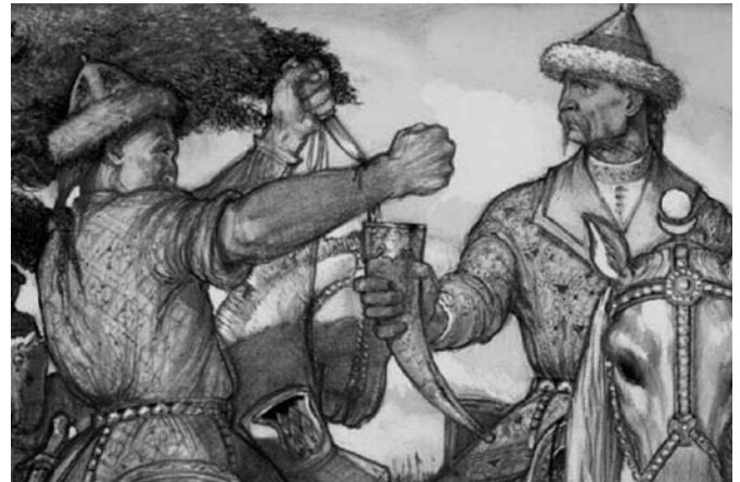
László Gyula: A vérszerződés

De térjünk vissza a borhoz! Bor-Tengri, melyből a tengri az isten ősi nevét jelentheti, együttesen pedig valószínűleg a Föld és az újjászületés istenét azonosíthatjuk. A régi nomád vándorló népek ezen a szent helyen is áldozatokat mutattak be, s a bor, amellyel ezt végrehajhták, a rituáléval szorosan összefonódva, egy idő után már magát az italt