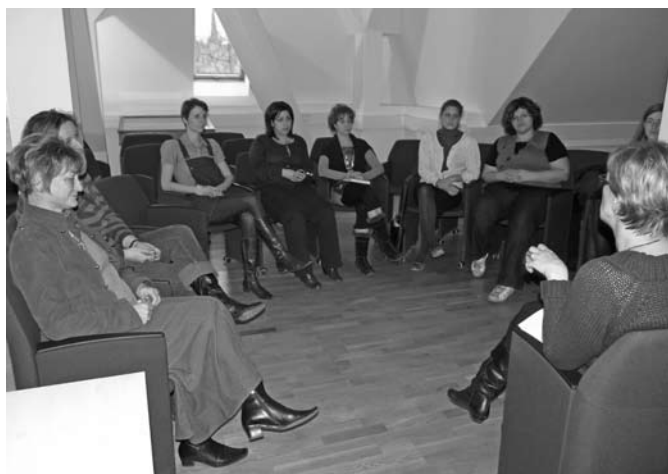
A szakeketet előbb a szakmaiság, majd később a vidámság jellemezte

Március 17-én az esti órákban frissen főtt kávé illata, gyertyafényes asztalok és Edith Piaf hangja várta a tetőtéri társalgóba érkezőket. A Szociálpedagógia Szakkollégium szervezésében másodszor rendezték meg a szociálpedagógia szakeketet a Benedek Elek Pedagógiai Karon.