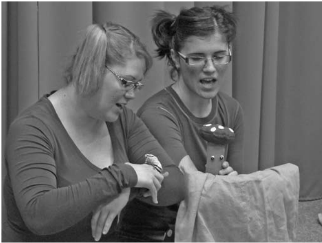
A bábjáték: felelősség