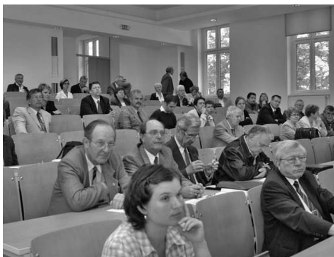
A téma fontosságát a résztvevők száma is jelezte