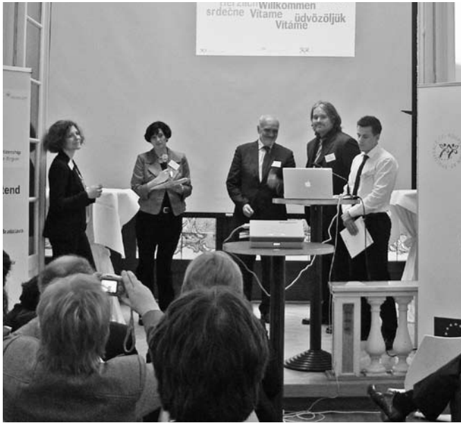
A projekt rendezvényein több ezren vettek részt

A NYME Apáczai Kar és a Bécs Városi Oktatási Bizottság Európai Hivatal Európai Irodája 2008 óta vesz részt az EdTWIN (Oktatási ikerkapcsolatok a Cenrtope Régióban) projekt koordinálásában pozsonyi, brnói partnerekkel együtt.