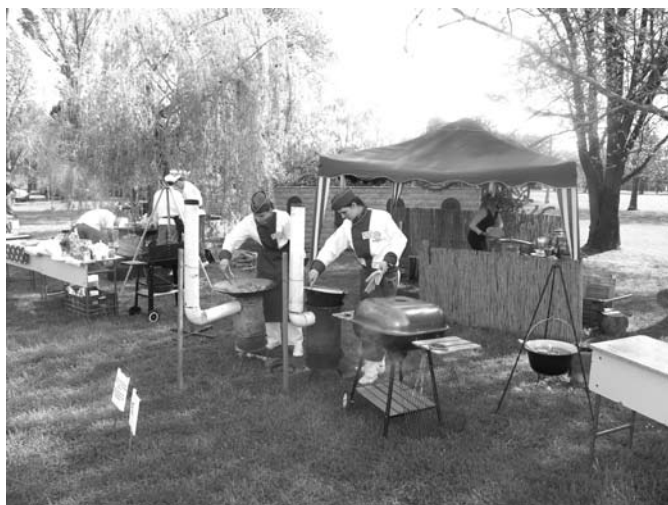
A kulináris élvezetet a Pannonhalmi Apátsági Pincészet kitűnő borai emelték.