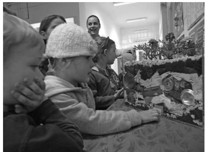
Szemmagasságba kerültek a szeméthyegyek... A jereváni Kék Óvoda ovisai nézik a szemétkupac tetején tündöklő virágokat.