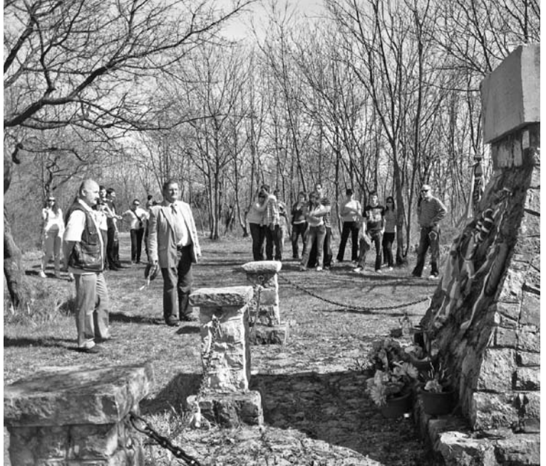
Történelmi zarándokúton az Apáczais hallgatók

Az út minden tekintetben nagy élmény volt, talán az egyik legjobb, vagy a legjobb, amin valaha voltam. A társaság jó csapatná vácsolódott, a tanár úr nagyon jól összefogta a különböző szakos hall-