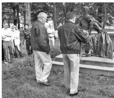
Koszorúzás Koltón a Petőfi szobornál

Az Erdélyi Magyar Műszaki Tudományos Társaság (EMT) az idén ünnepli alapításának 20. évfordulóját. A 11 szakosztályt egyesítő társaságnak az erdélyi magyar földmérőket összefogó szekciója is van, elnöke éppen Sopronban szerezte meg a doktori címet a 90-es évek elején. Már a kezdeti években szoros kapcsolat alakult ki a fehérvári GEO és az EMT Földmérő Szakosztálya között s ez a kapcsolat azóta is tart.