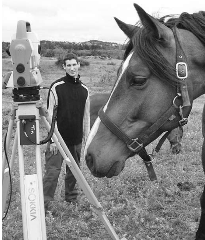
A műszerek iránt nem csak a GEO hallgatói érdeklődtek