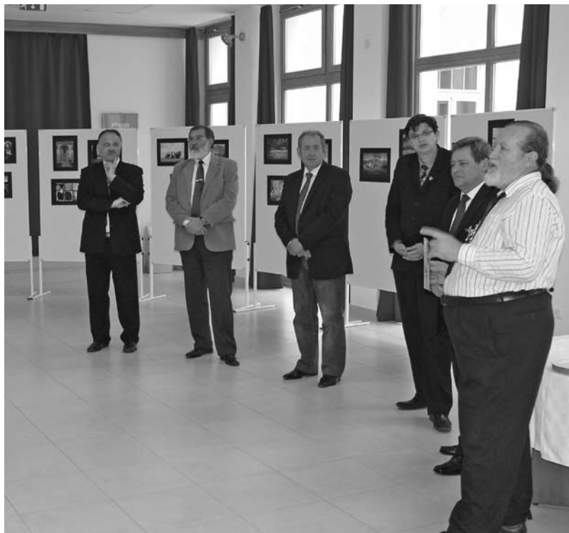
A „Vajdaság a tenyerünkön” című fotókiállításán több, mint húsz vajdasági fotóművész alkotásait láthatták az érkezők

A szabadegyetem délelőttjén, főként idegenforgalmi szakmunkés szakos hallgatókkal kiegészülve, rövid kirándulásra indultunk. Ragyogó napsütésben nyílt lehetőségünk bebarangolni a Páneurópai Piknik helyszínét és a tavaszi héricskekkel tarkított fertőrákosi kőfejtőt.