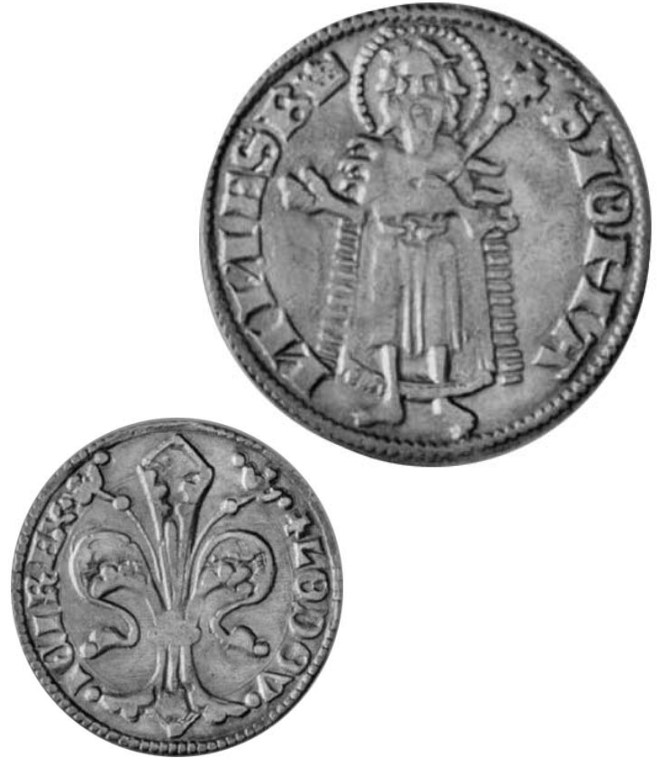
I. (Nagy) Lajos király (1342-1382) arany forintja. Az előlap felirata: LODOV - ICI REX (Lodovici rex - Lajos király)

A tizedhez szorosan kapcsolódott a pecsétpénz (pecunia sigillaris) jövedelme is. A tizedterületekről elszállított borról mindig engedélyt, pecsétes írást kellett kérni, amelyet kezdetben ingyen állítottak ki. Erre azért volt szükség, hogy a borvidékekről a dézma begyűjtése előtt ne lehessen kicsempészni tized alá nem eső bormennyiséget. II. András idején ezért pénz szedni még tilos volt, a XIV. század közepére azonban ez érvényes joggá alakult. A pecsétpénz összege általában 10-12 dénárt tett ki. Később hegyvám címén földesúri adóvá alakult és a vámszedő helyeken gyűjtötték be. A hegyvám, amit a másutt