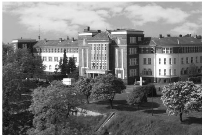
A Savaria Egyetemi Központ épülete